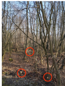
Esche mitten im nicht begehbaren Wald + Jungbäume