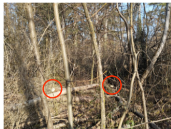
Buche Jungbaum ca. 25-30 Jahre mitten im Wald