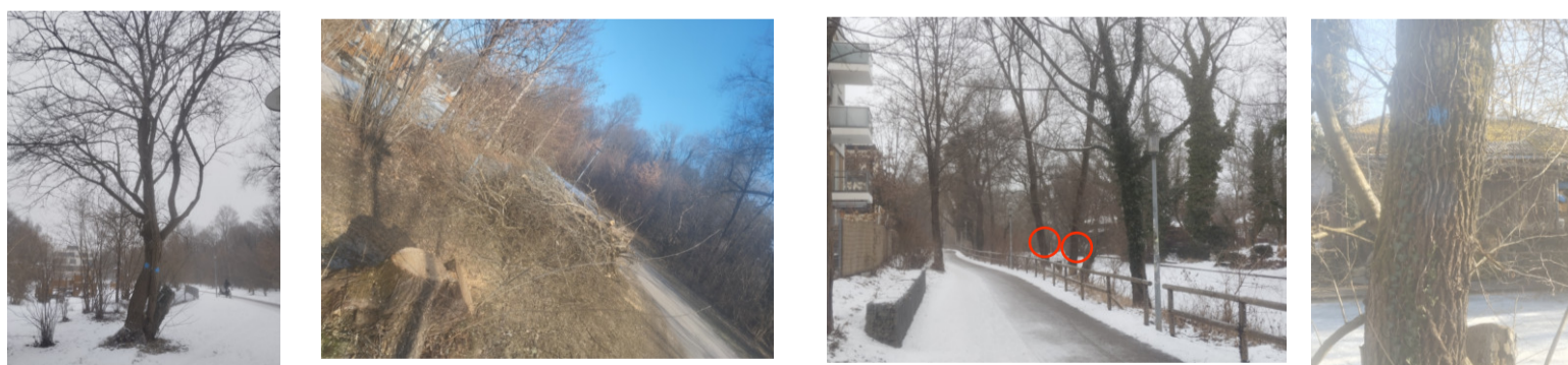
Vorher - Nachher

Isartalbahnweg am Auer Mühlbach (Fällungen 19.-23.01.2026)