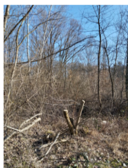
Fällung von Bäumen auf Wiese abgelegen von Wegen und Mitfällung von Jungbäumen.