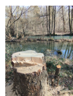
Schneise der Verwüstung hin zu uraltem Baum am Mühlbach fern ab von Wegen, Mitfällung vieler Jungbäume; Buchen ca. 15 - 20 Jahre alt.