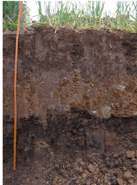
Aufgefüllter, "verritzter" Boden aus ehemaligem Braunkohleabbau in unmittelbarer Nähe