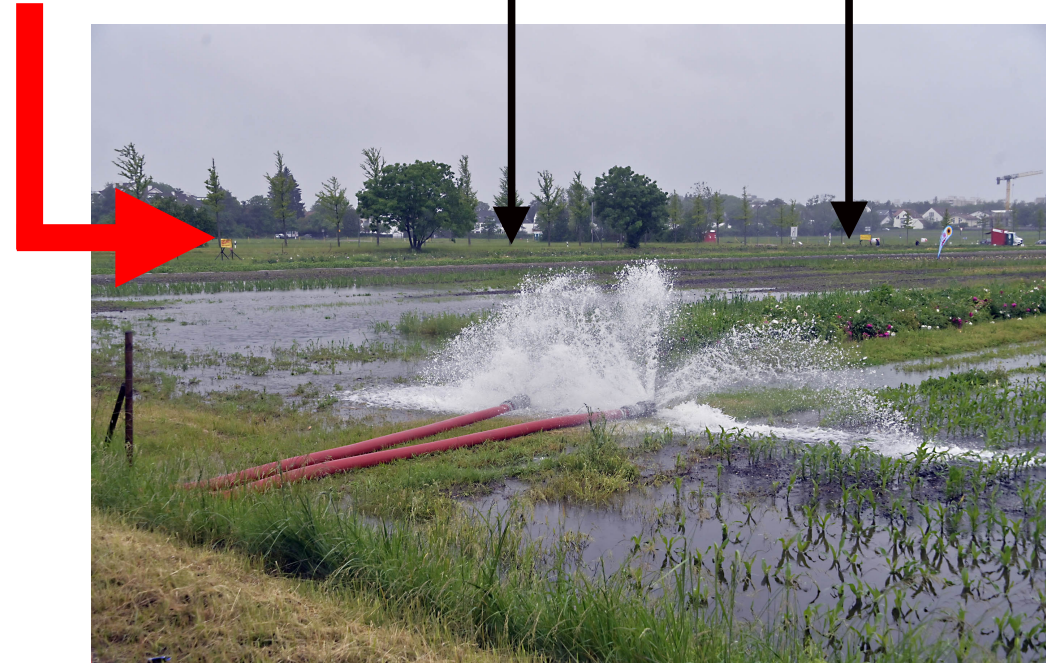
„Hochwasser am Hachinger Bach am 01. Juni 2024: Die Feuerwehr pumpt das Wasser aus dem Hachinger Bach auf ein Feld bei Taufkirchen ab.“

geplantes Bebauungsgebiet (Feld zwischen Oberweg und Münchner Straße)