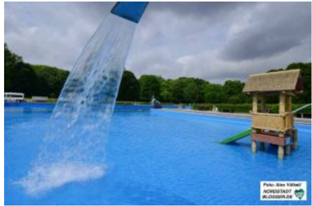
Das Freibad Stockheide im Hoeschpark wird diesen Sommer geschlossen bleiben.