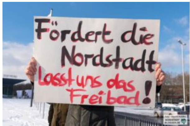
Der Appell verhallte.