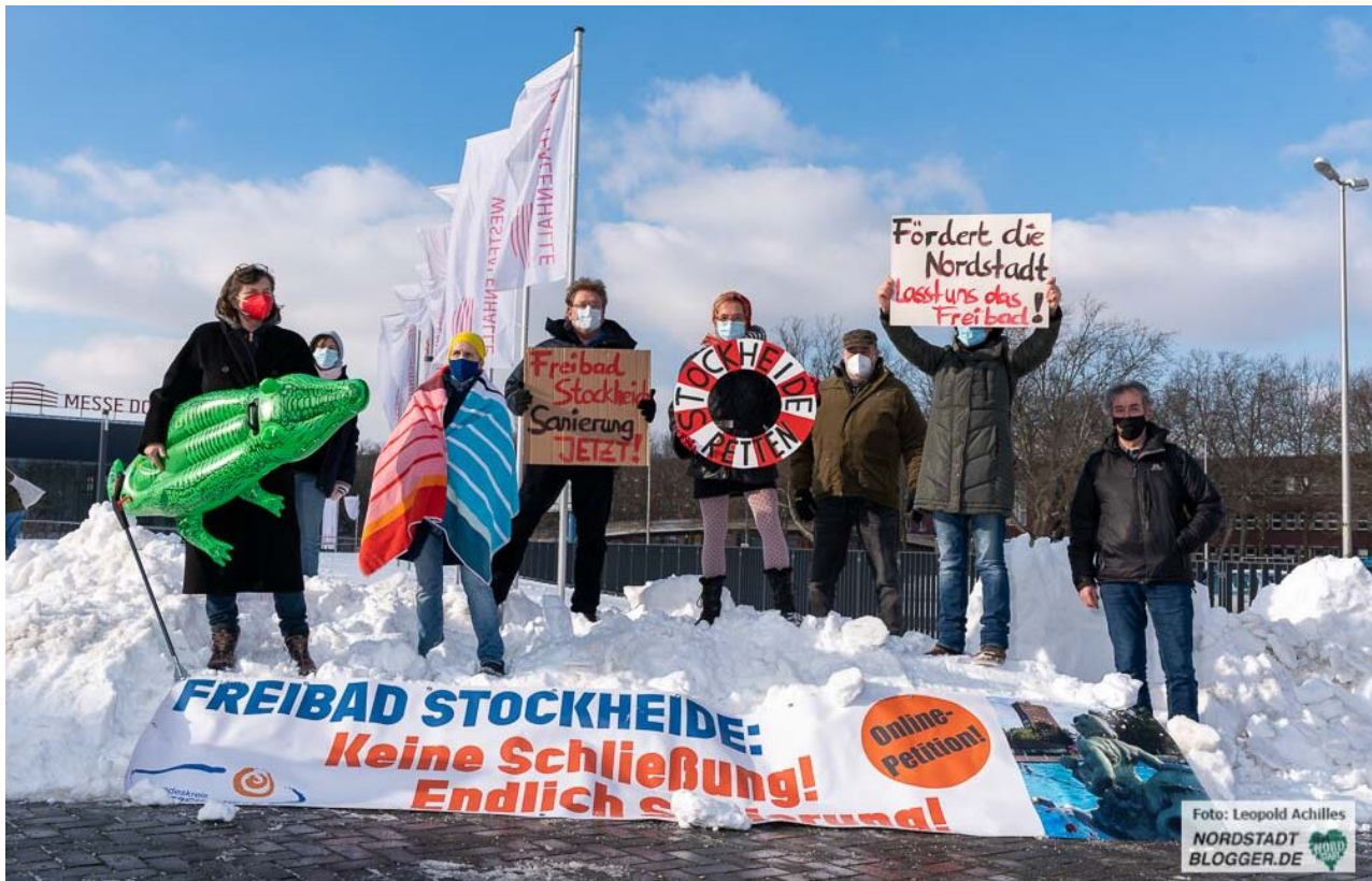
Freunde des Freibads Stockheide warben vergeblicher eine kurzfristige Sanierung des Bades.

Enttäuschung beim Freundeskreis Stockheide und den Stammgästen des Freibads Stockheide: Sie müssen sich in diesem Sommer – wenn nicht sogar für immer – ein anderes Bad zum Schwimmen und Entspannen aussuchen. In diesem Jahr wird das traditionsreiche Bad nicht repariert und kann dadurch nicht öffnen. Das entschied am Donnerstag die Mehrheit der Mitglieder im Rat. Die Politiker*innen insbesondere von CDU und SPD lehnten es zudem ab, eine Grundsatzentscheidung zum Erhalt des einzigen Freibads in der Nordstadt zu treffen – sie wollen (wir fraktionsübergreifend vereinbart) das im Rahmen der Erstellung des Masterplans Sport beauftragte Bädergutachten abwarten.