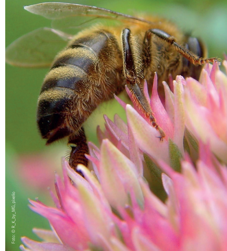
Gestaltung: Stiftung für Mensch und Umwelt, Berlin

So., 20. Oktober 2019, 10 bis 15:30 Uhr Fachvorträge an der Freien Universität Berlin Erntefest auf der Domäne Dahlem (10 bis 18 Uhr)