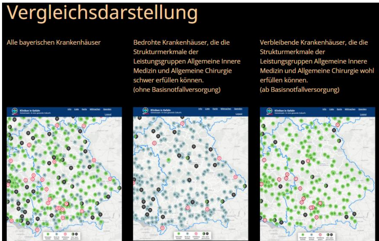
Abb.: Bedrohte bayerische Krankenhäuser aufgrund des KHAG 4

Die Aktionsgruppe Schluss mit Kliniksterben in Bayern hat die anstehende Krankenhausreform mehrfach scharf kritisiert und eine Auswirkungsanalyse dazu erstellt. 3 Insbesondere Krankenhäuser ohne Basisnotfallversorgung gelten nach dem neuen KHAG als strukturell gefährdet und sind von einer Schließung bedroht. In Bayern nehmen nur 41% der Klinikstandorte an der für Allgemeinkrankenhäuser notwendigen Basisnotfallversorgung oder höherwertigen Notfallversorgung teil. Eine auf nur 3 Jahre befristete Ausnahmegenehmigung für Leistungsgruppen nur im Einvernehmen mit den Krankenkassen wird ein massives Kliniksterben auslösen.