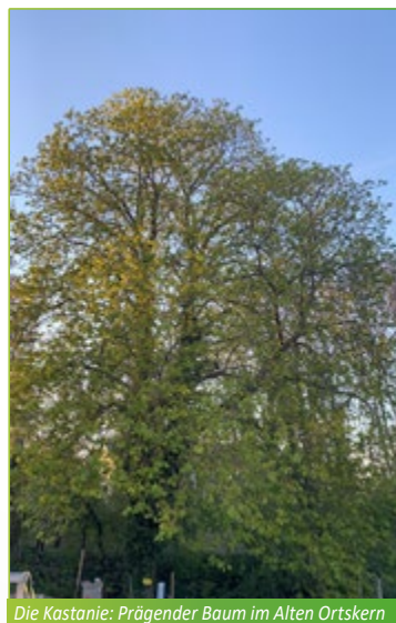
Die Kastanie: Prägender Baum im Alten Ortskern

Also, das Verfahren wird auch dank unserer Bürgerinitiative noch lange dauern. Wir sollten alle Geduld zeigen und das Thema nicht aus den Augen verlieren.