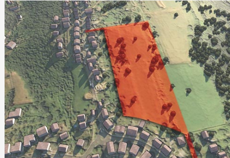
Im Entwurf des neuen Flächennutzungsplans als Baugebiet vorgesehene Fläche.

Sie erfüllen eine überaus wichtige Funktion für das städtische Klima (als Kaltluftschneise zur Linderung von „Urban Heat Islands“), den Artenschutz (als Biotopmosaik), die Erholung der Bevölkerung und dienen einer nachhaltigen Stadtentwicklung im Bezug auf das mikroklimatische Verbundsystem.